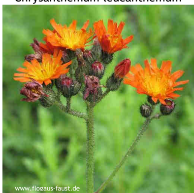
Hieracium x rubrum