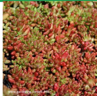
Sedum album `Coral Carpet`